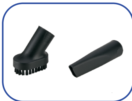
BOQUILLA DOBLE (FINA + CEPILLO)