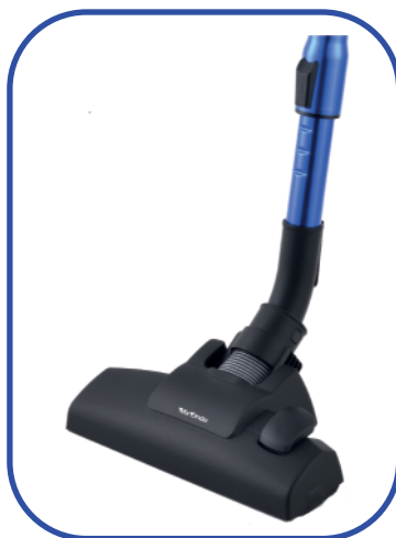
CEPILLO CON DOS POSICIONES (SUELO Y ALFMOBRA / MOQUETA)

Artículo: 470.73-PT EAN: 8413366470738 U/caja: 4